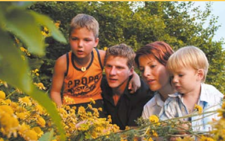
Die Themengärten sind ein beliebter Ausflugsort für Familien.

Blühende Gärten, Parks und Blumen sind fester Bestandteil der Landschaft des Naturparks Pöllauer Tal. In der Gemeinde Pöllauberg wurde mit viel Sinn für Ästhetik und Liebe zum Detail eine besondere Attraktion geschaffen: 11 verschiedene, frei zugängliche Themengärten rund um die Wallfahrtskirche Pöllauberg geben Ihnen auf phantasievolle Weise Einblick in die Kultur und Landwirtschaft des Naturparks.