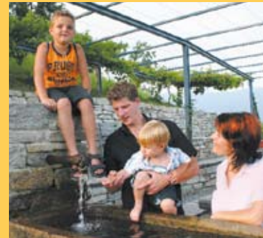
Der Weingarten ist interessant und gemütlich zugleich.