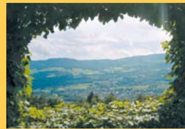
Das Zimmer mit Aussicht bietet einen umwerfenden Ausblick.

Ein einzigartiges Haus für einzigartige Tiere. Wussten Sie, dass der bunt schillernde Vogel aus dem fernen Asien stammt?