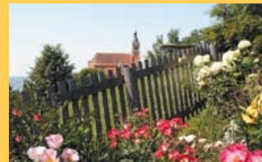
Vom Rosenduft verzaubert werden.