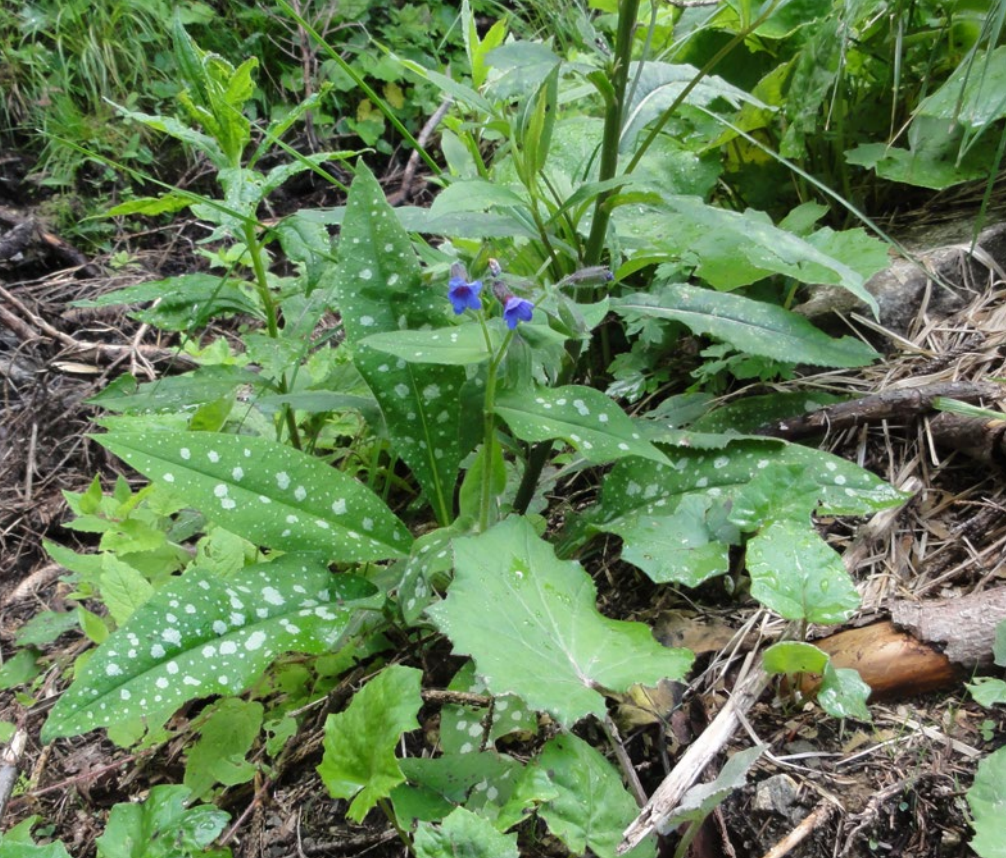
Fleck-Lungenkraut (grünes Handwerk - M. Ressel)